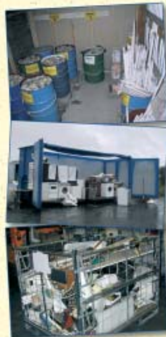
På stasjonane vert avfallet sortert!