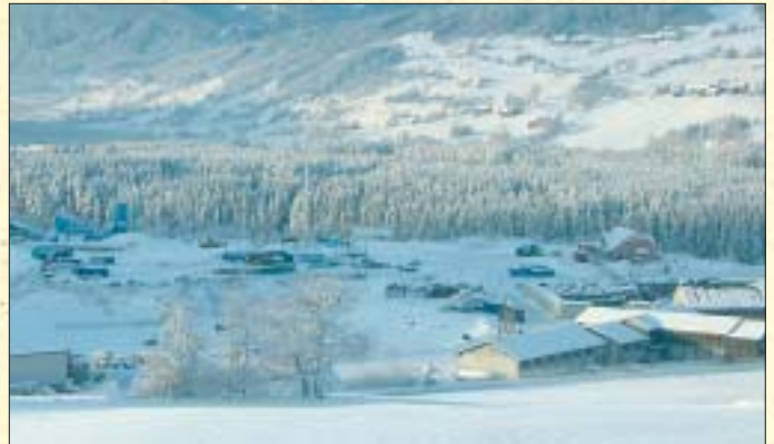
Bjørkemoen, IHM sitt deponiområde på Voss.

I 2003 har IHM teke imot ca. 1 100 tonn papir, 127 tonn papp, 17 tonn drikkekartong, 96 tonn hushaldsplast, 32 tonn plastfolie, 72 tonn landbruksplast og 3