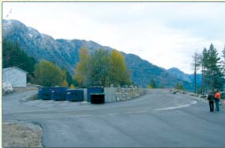
Her ser du den nye miljøstasjonen i Jondal.

Liste over miljøstasjoner og opningstider, sjå s. 4. ellen@ihm.no