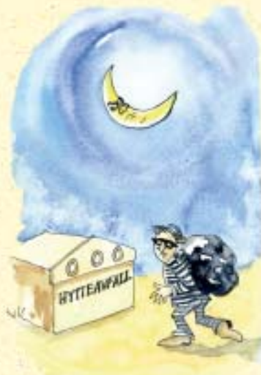
Illustrasjon: Solveig Anderssen, Ibox AS