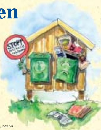
Illustrasjon: Solveig Anderssen, Ibox AS

Dersom du ønskjer å stoppe reklamen på hytta, ta kontakt med IHM for å få tilsendt klistremerke til å sette på postkassa.