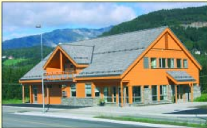
IHM sitt nybygg på Bjørkemoen.

Vi vonar at den nye lokaliseringa gjev oss enda betre høve til å gje kundane våre god oppfølging og service! Velkomen til Bjørkemoen 60!