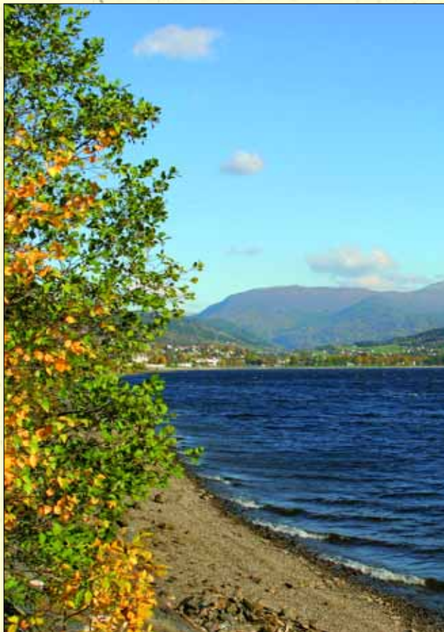
Haustbilete frå Vangsvatnet.