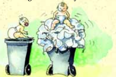
Illustrasjon: Solveig Anderssen, IBOX AS

Du kan få 500 kr i støtte om du bur i IHM-regionen og barnet ditt nyttar tøybleier framfor eingongsbleier. Spar på kvitteringa og ta kontakt for å få søknadsskjema om støtte.