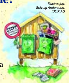
Illustrasjon: Solveig Anderssen, IBOX AS

Det held med eit klistremerke på postkassa for å reservere seg mot uadressert reklame. Slikt klistremerke kan du få hos IHM.